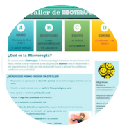
Taller de risoterapia

A pesar de las dificultades ocasionadas por la pandemia, en CLARÁ hemos sabido reinventarnos y ofrecer actividades y formaciones que enriquecen. Gracias a vuestra cercanía, en las dificultades más inesperadas, hemos seguido adelante con una sonrisa.