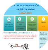
Webinar Comunicación en pareja