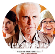
Cineforum "Una canción para Marion"