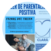
Webinar Parentalidad positiva