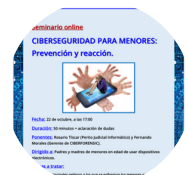
Webinar Ciberseguridad para menores

Durante el período de confinamiento acompañamos a nuestros mayores, mediante un seguimiento telefónico, brindándoles apoyo y cercanía.